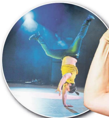
Die Breakdancer aus dem Jugendkulturzentrum MultiCult sorgten für den lokalen Glanzpunkt.